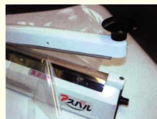
溶断タイプ 使用例

オプションの溶断タイプはシールと同時にカットできますので、シュリンク包装・製袋加工に最適です。