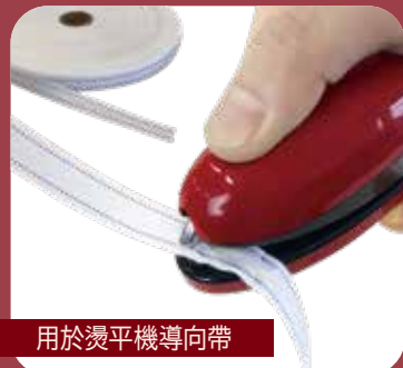
用於燙平機導向帶