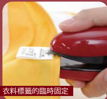
衣料標籤的臨時固定